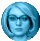
JORGOVANKA TABAKOVIĆ Kontinuitet politike stabilnosti uz podršku privrednom rastu 06